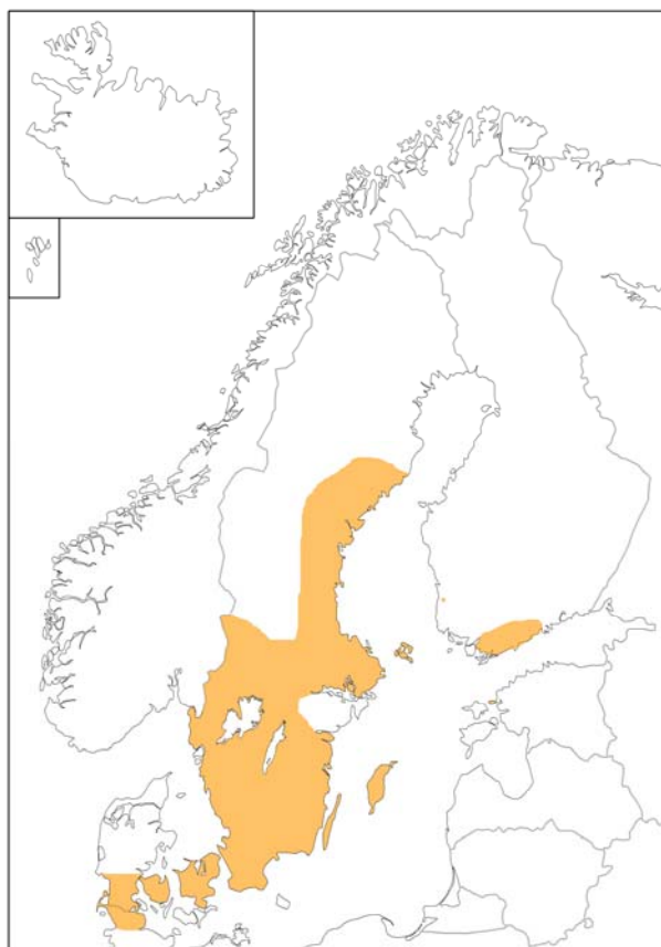
Den ungefärliga utbredningen av ägonamn på - spjäll i Danmark, Finland och Sverige.

Lindqvist anser denna betydelse vara överförd från den vanliga, nämligen "fyrkantig lapp af trä, järn l. sten". Han hänvisar i sammanhanget till en handbok i